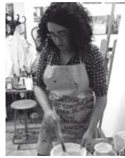
Festa de la Poesia.

Des d'El Taller del carrer Sant Sebastià, el qual dirigeixo, us volem presentar 7 intervencions plàstiques que podreu veure durant el cap de setmana de la 6a