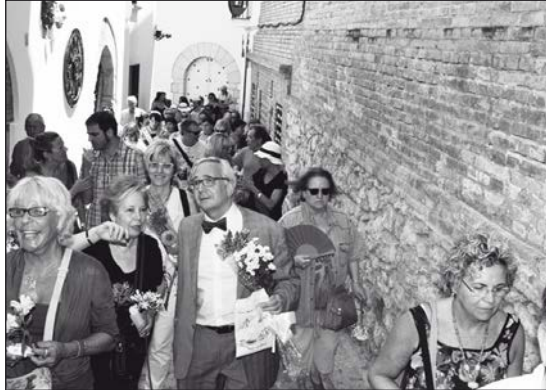
Sitgetans i poetes, tots plegats i caminant pel carrer d'en Bosch, durant la cercavila de la 5a Festa de la Poesia a Sitges

us convoquem a la tradicional i ja tan popular Rebuda dels Poetes, a la plaça de l'estació (Plaça d'Eduard Maristany), divendres dia 15 a les sis de la tarda, i a la posterior i sempre estimulante